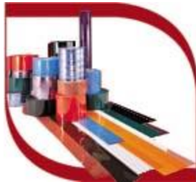
Rouleaux en PVC