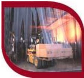
Rideaux à lanières