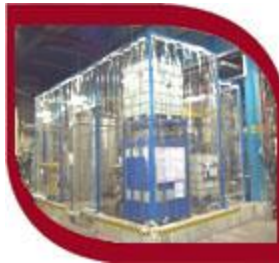
Rideaux style "douche"