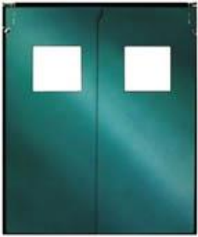
AirGard Modèle 300

Moyen économique de disposer d'une porte battante. Système de charnière à gravité monté en haut de la porte.